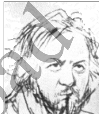
Mihail Ivanovics Glinka