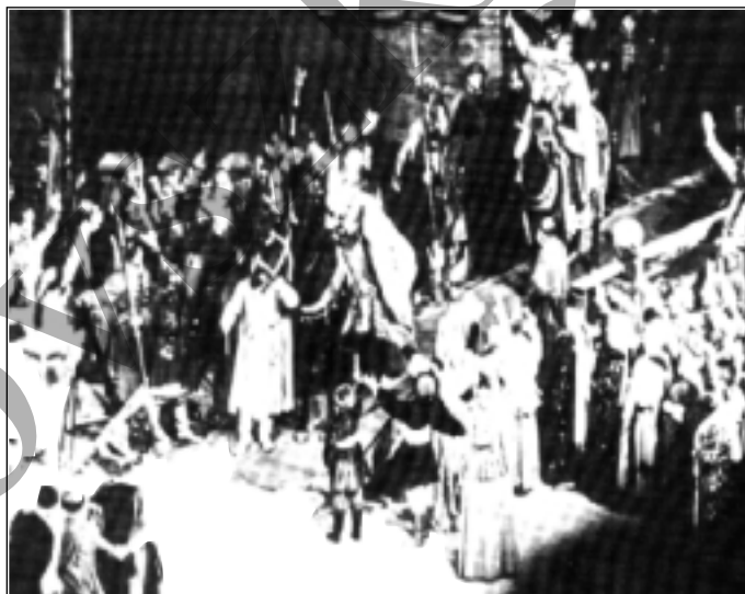
Az „Ivan Szuszanjin” zárójelenete.

1881 február 16-án halt meg Szentpéterváron.