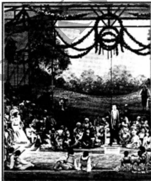
Nürnbergi mesterdalnokok (színpadkép)