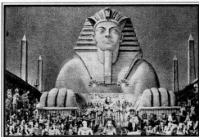
Színpadkép az Aidából

Nabucco (Nabukko) , Rigoletto , Traviata , A trubadur , Don Carlos (Karlosz) , Az álarcosbál , Aida a Szuezi - csatorna ünnepélyes megnyitására készült, Otello , Falstaff , Requiem (Gyászmise) Manzoni emlékére íródott.