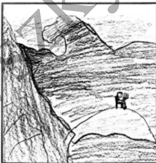
Jámbor Katalin rajza a műről.