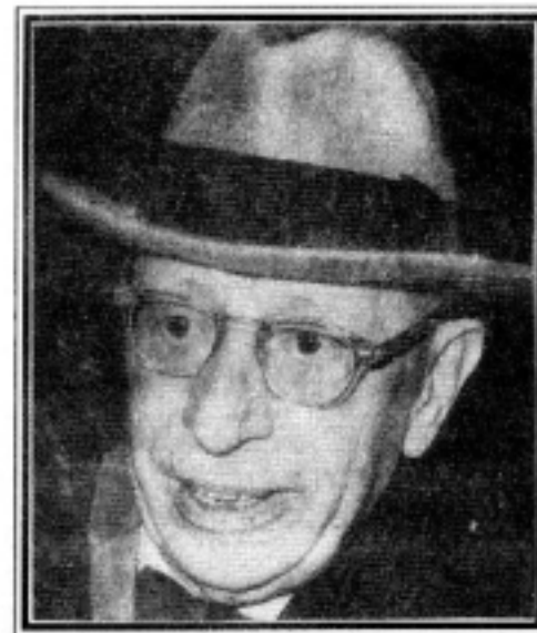
IGOR SZTRAVINSZKIJ (1882. MÁJ. 5. – 1971. ÁPR. 6.)