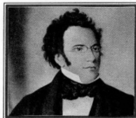
FRANZ SCHUBERT ( 1797 - 1828 )