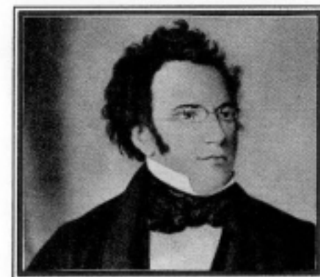
FRANZ SCHUBERT ( 1797 - 1828 )