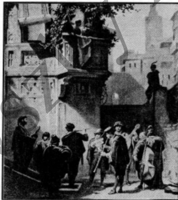
Carl Spitzweg (1808 — 1885): Spanyol szerenádj

Stílusából olyan zenészek indultak, mint Donizetti , Verdi .