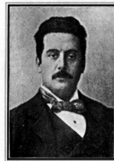
GIACOMO PUCCINI (1858.DEC.22 — 1924.NOV.29)