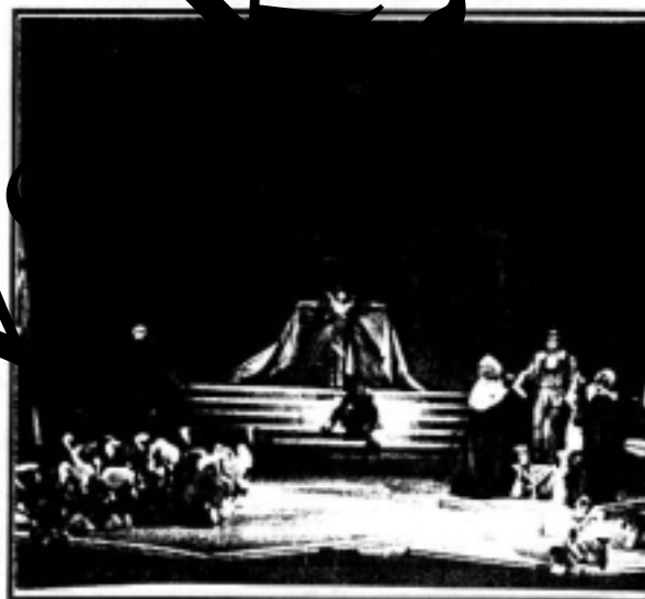
Prokofjev: A három narancs szerelmese .

A herceg megszereti és feleségül veszi a szépséges tündérlányt. A hercegi nyeri egészségét, életkedvét.