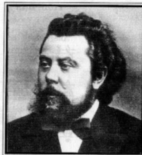
MOGYESZT PETROVICS MUSZORGSZKIJ 1839.MÁRC.21 — 1881.FEBR.16.

A hét zeneszerzője: MOGYESZT PETROVICS MUSZORGSZKIJ