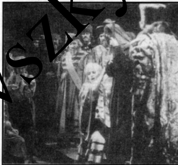
Színpadijelenet a Hovanscsina c. operából

1881 február 16-án halt meg Szent-péterváron.