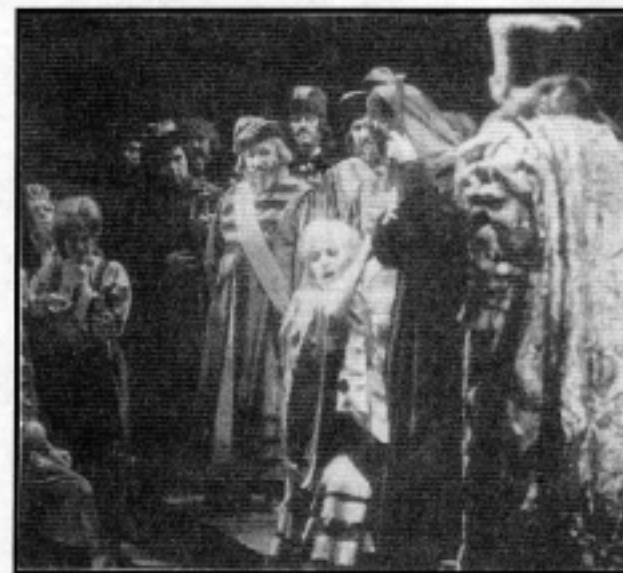
Színpadij jelenet a Hovanscsina c. operából

1881 február 16-án halt meg Szent-péterváron.