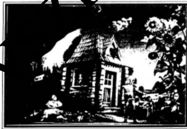
Részlet a Háry Jánosból