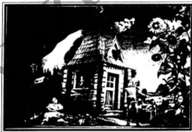
Részlet a Háry Jánosból