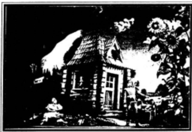
Részlet a Háry Jánosból