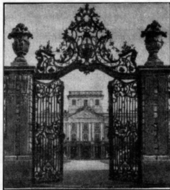
A fertői kastély