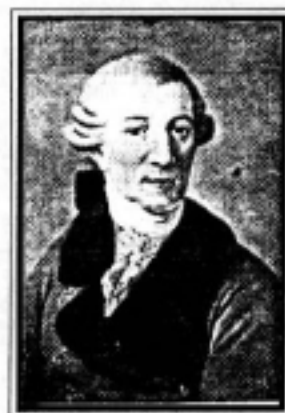
JOSEPH HAYDN (1732 — 1809)