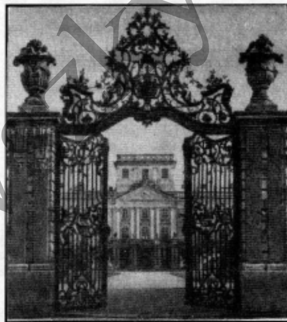
A fertői kastély