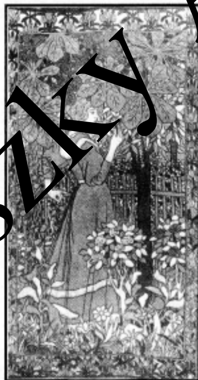
Rózsát tartó nő ( Ritpl-Rónai J. festménye )