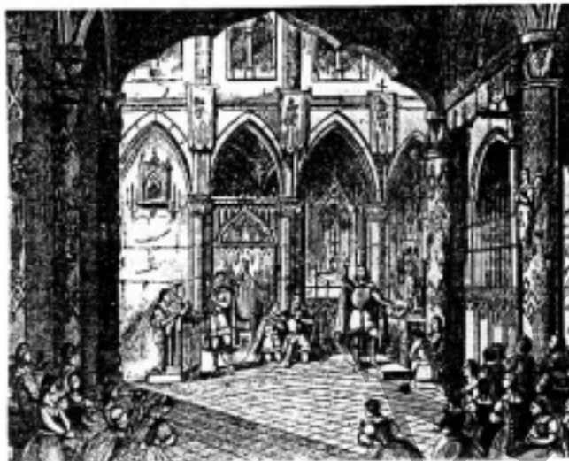
Színpadkép a Hunyadi László c. operából ( korabeli metszet )