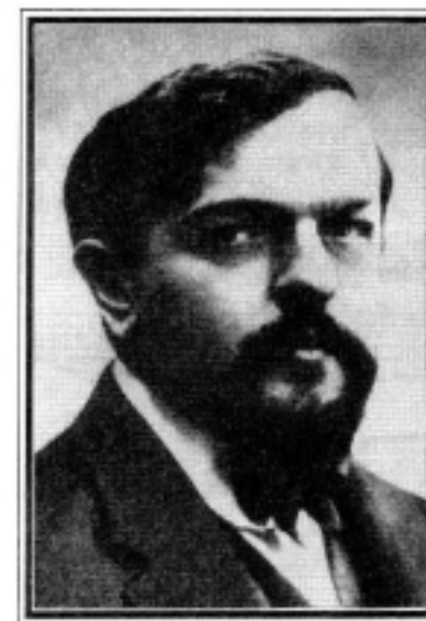
CLAUDE DEBUSSY (1862 — 1918)