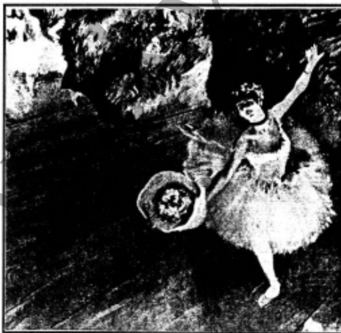
Degas: Primabalerina. 1876 k. Párizs, L