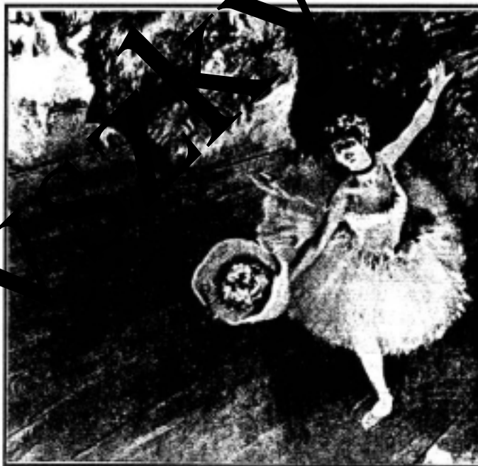
Degas: Primabalerina. 1876 k. Párizs, L