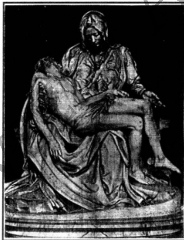
Michelangelo Pietája a római Szent Péter-székesegyházban látható (1489-99)

J.S.Bach két hatalmas művében a János és Máté-passióban beszéli el Jézus szenvedését és keresztfeszítését.