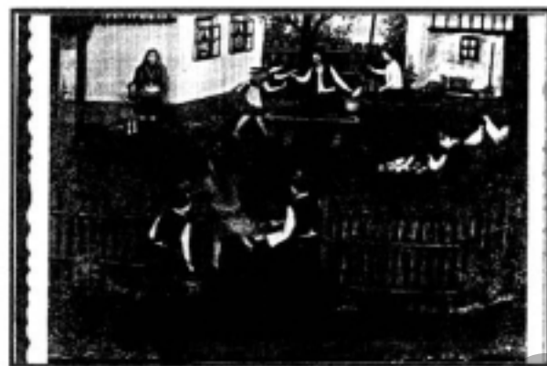
Török János natv festő Húsvéti locsolkodás (1982)