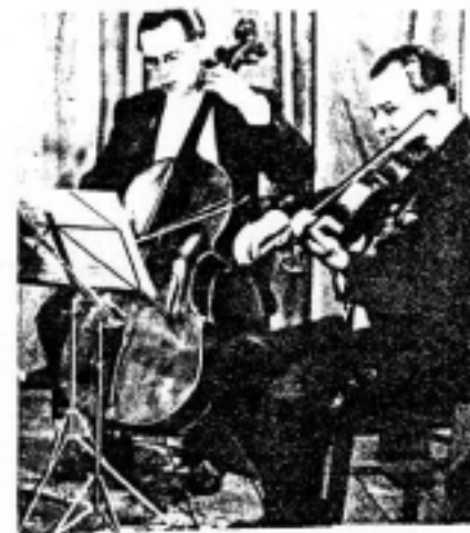
CSELLÓ ÉS BRÁCSA