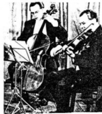
CSELLÓ ÉS BRÁCSA