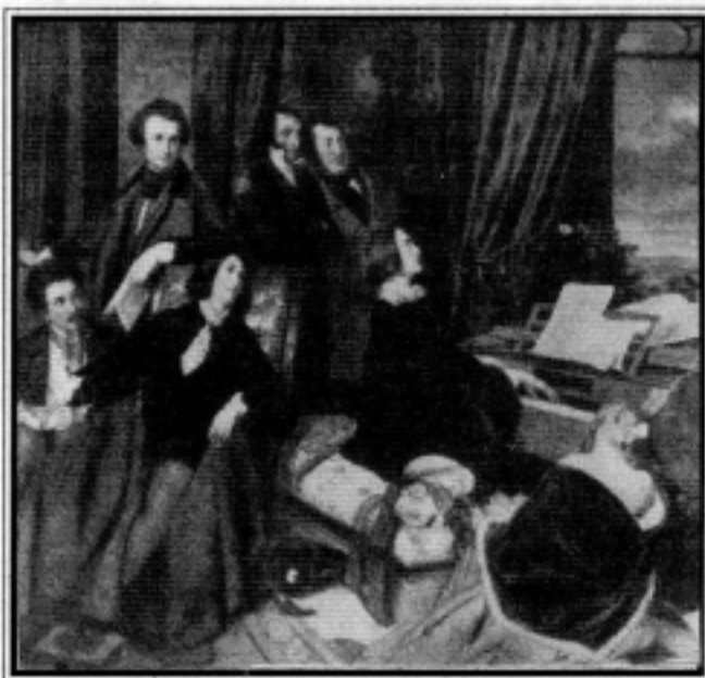
Liszt Ferenc barátai körében ( Danhausi fest-ményc )

Ő maga kiváló, ünnepezt zongoraművész volt.