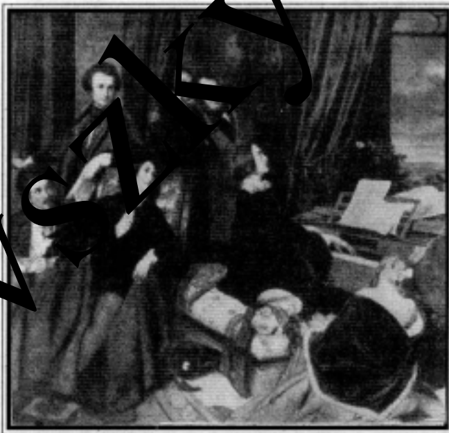
Liszt Ferenc barátai körében (Danhauseri fest-ményc)

Ő maga kiváló, ünnepezt zongoraművész volt.