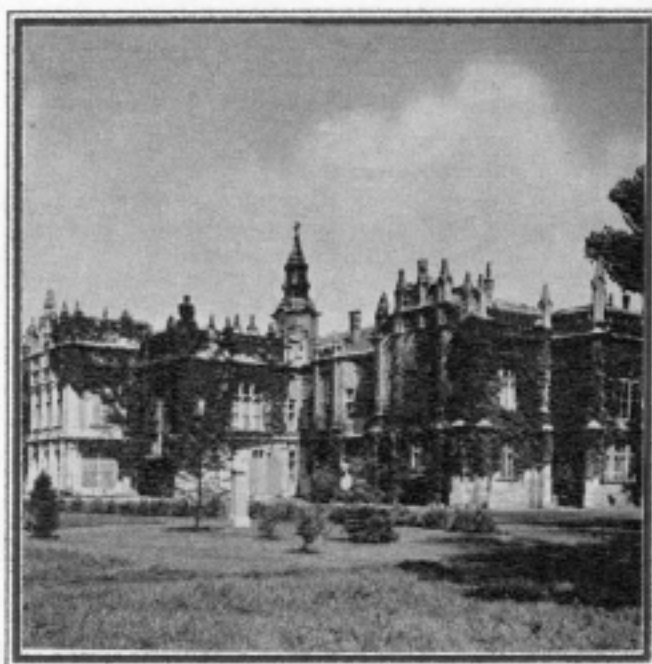
A martonvásári Brunszvik - kastély

Művének ekkor az „Eroica” (hősi) szimfónia nevet adta.