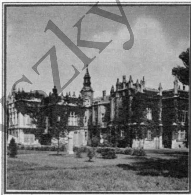
A martonvásári Brunszvik - kastély

Művének ekkor az „Eroica” (hősi) szimfónia nevet adta.