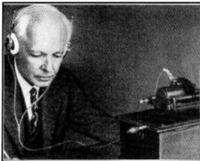
Bartók Béla a fonográffal