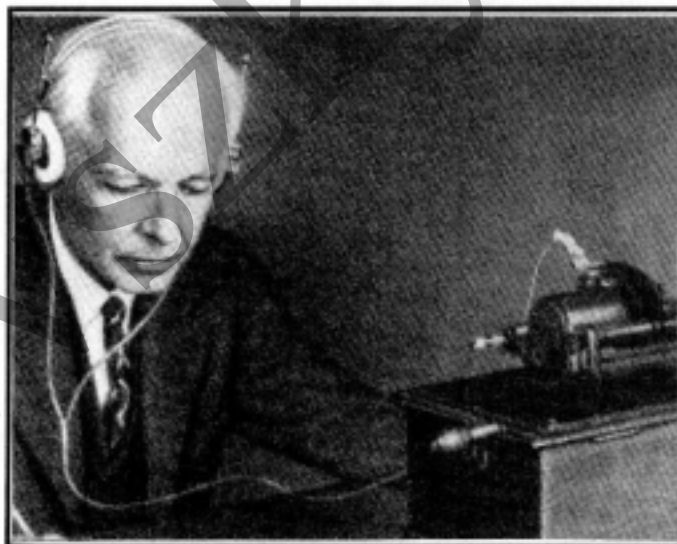
Bartók Béla a fonográffal