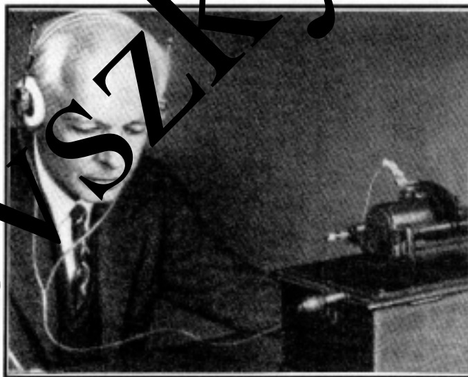
Bartók Béla a fonográffal