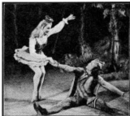
A fából faragott királyfi