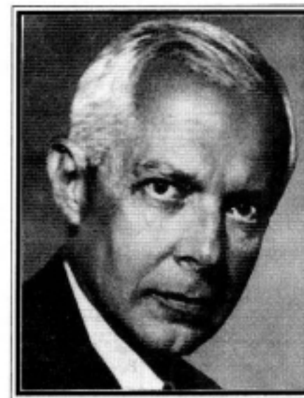
BARTÓK BÉLA (1881 — 1945)