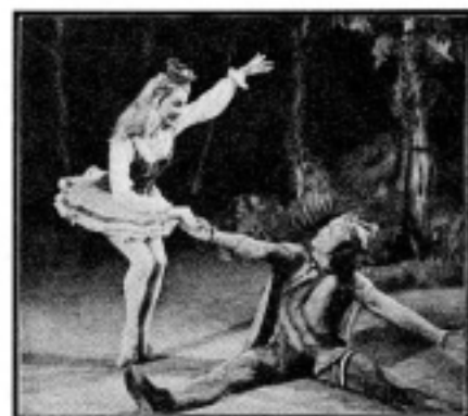
A fából faragott királyfi