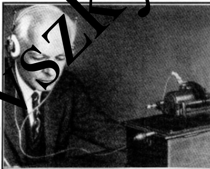
Bartók Béla a fonográffal