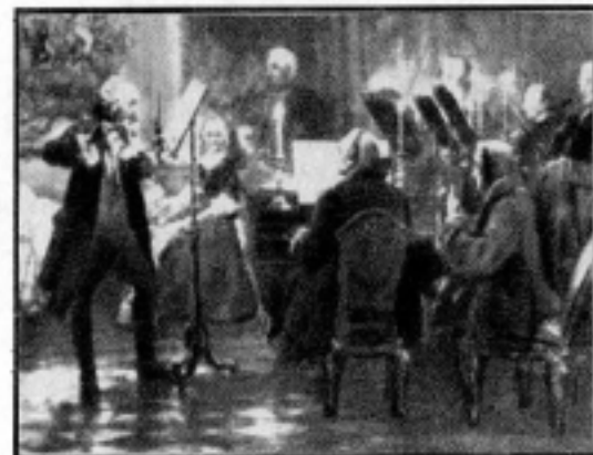
Menzel: Hangverseny Potsdamban