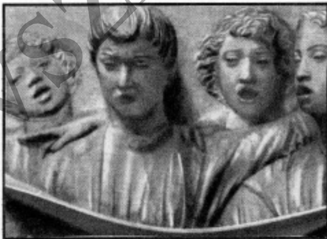
Luca della Robbia: Éneklő fiúk