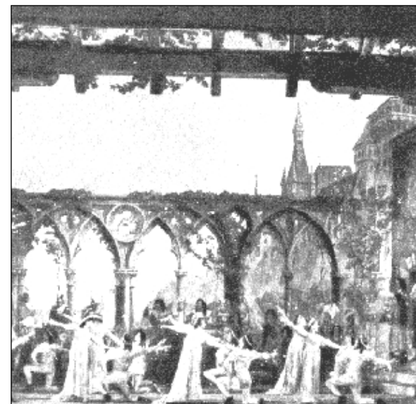
Előadás az Operaházban