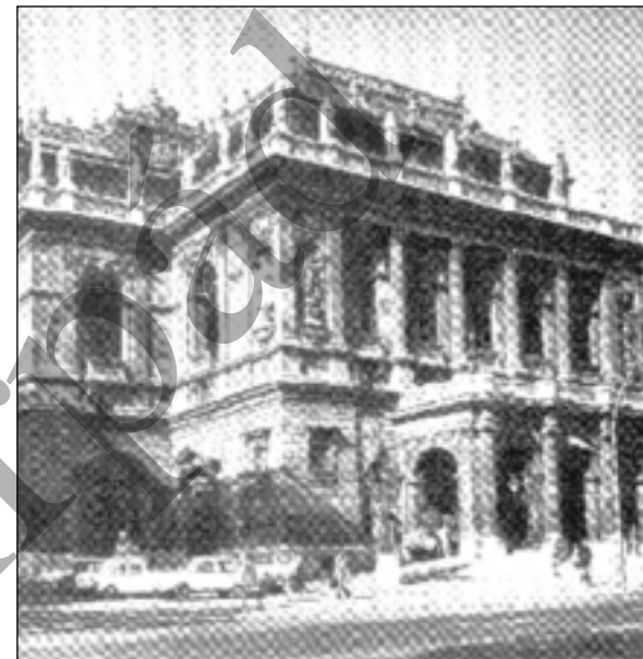
Magyar Állami Operaház

Az épületet fennállásának 100. évfordulójára, 1984-re teljesen felújították.