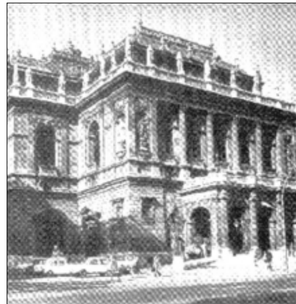
Magyar Állami Operaház

Az épületet fennállásának 100. évfordulójára, 1984-re teljesen felújították.