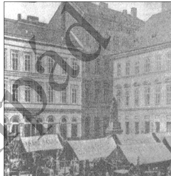
A Hal téri Zeneakadémia épülete

Hangversenyterme a budapesti zenei élet központja