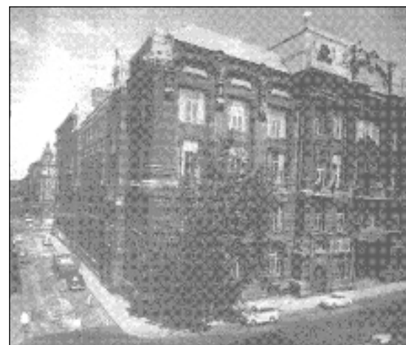
A Zeneakadémia, ma Liszt Ferenc Zeneművészeti Főiskola