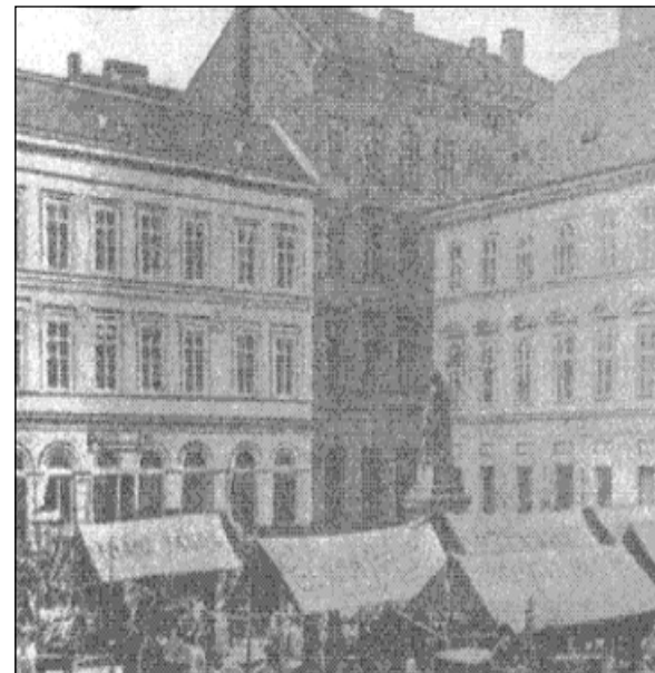
A Hal téri Zeneakadémia épülete

Hangversenyterme a budapesti zenei élet központja