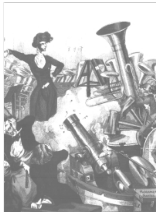
Karikatúra Berlioz bécsi hangversenyéről