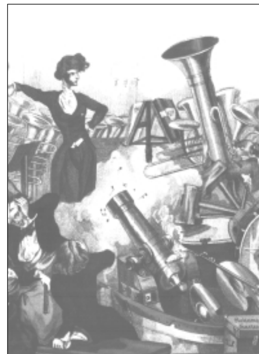
Karikatúra Berlioz bécsi hangversenyéről