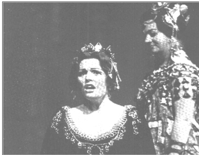
A trójaiak Covent Garden-i előadása — Dido

Ha egy kicsit rendezettebb és kifinomultabb zenei környezetben élt volna, bizonyosan sokkal többet ért volna el — írták életének s műveinek értékelői. Kortársai ugyanúgy felismerték benne a géniuszt, mint napjainkban mi.