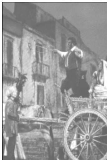
Jelenet a Parasztbecsületből.

Megsókolja megdöbbsent anyját s kis idő múltán felhangzik a rémült kiáltás: megölték Turiddu.