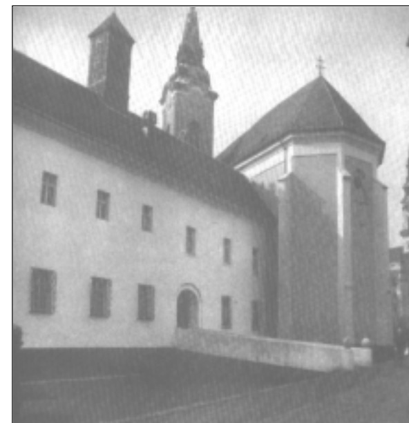
Kodály Zoltán Zenepedagógiai Intézet (Kecskemét)

Az intézet jelentős szerepet tölt be a világ minden tájáról érkező és a magyar zenepedagógusok továbbképzésében.