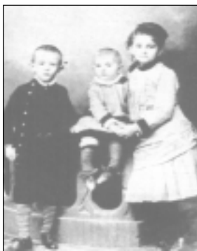
A Kodály testvérek

1882. december 16-án Kecskeméten született. Szülei műkedvelő szintén maguk is muzsikusok voltak. Az édesapa hegedült, az édesanya zongorázott, énekelt.