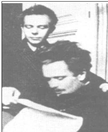
Kodály és Bartók

Kodály — mint zeneszerző — első hatalmas sikerét 1923-ban Pest, Buda és Óbuda egyesítésének 50.