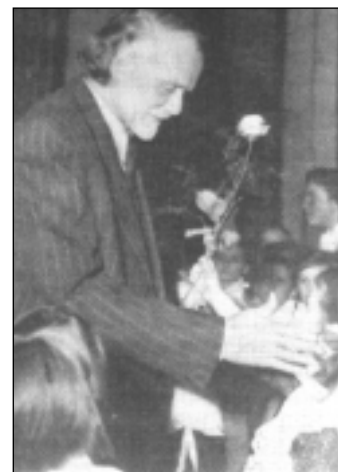
Kodály gyerekek között

Kodály Zoltán halálával mind a magyar, Kmind az egyetemes zenekultúrát pótolhatatlan veszteség érte. 1967. március 6-án halt meg. Tisztelők sokasága kísérte utolsó útjára az európai hírű zeneszerzőt, a minden művében és tettében lelkes pedagógust, az elkötelezett magyar hazafit.