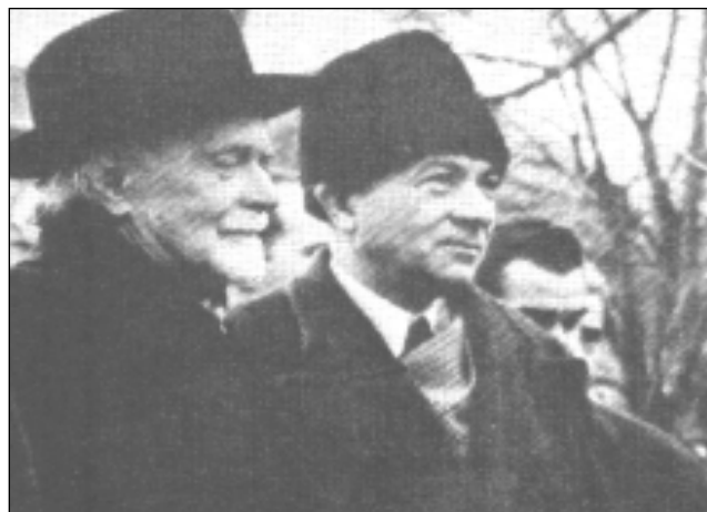
Kodály Illyés Gyulával

évfordulójára írt művével, a Psalmus Hungaricusszal (Magyar zsoltár) aratta.