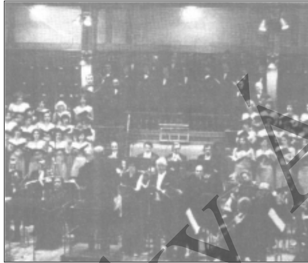
Oratóriumi előadás a Zeneakadémián

Julius Caesar ( Juliusz Cézár ) és Xerxes - a perzsa királyról szóló opera Messiás c. oratórium, melynek Halleluja kórusrészletét, az angolok ma is felállva hallgatják végig, mint egy himnuszt!