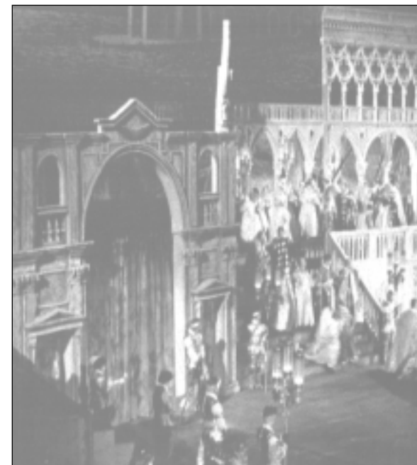
A Gioconda egy veronai előadásán