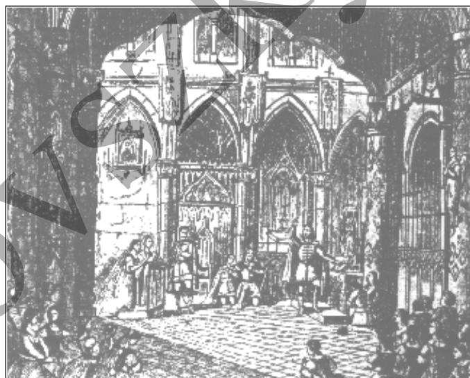
Színpadkép a Hunyadi László c. operából.