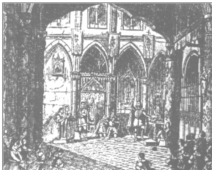
Színpadkép a Hunyadi László c. operából.