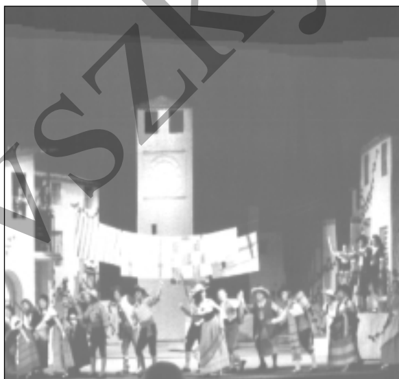
Donizetti: Szerelmi bájital.