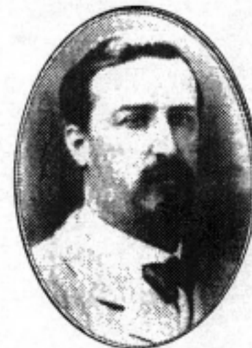
Alekszandr Borogyin (1833 - 1887)