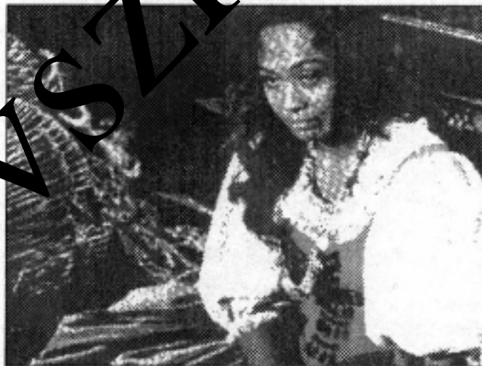
A halhatatlan Carmen