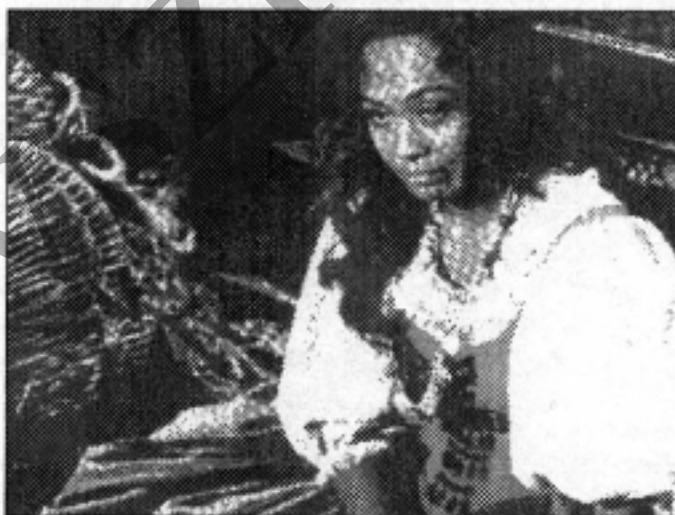
A halhatatlan Carmen