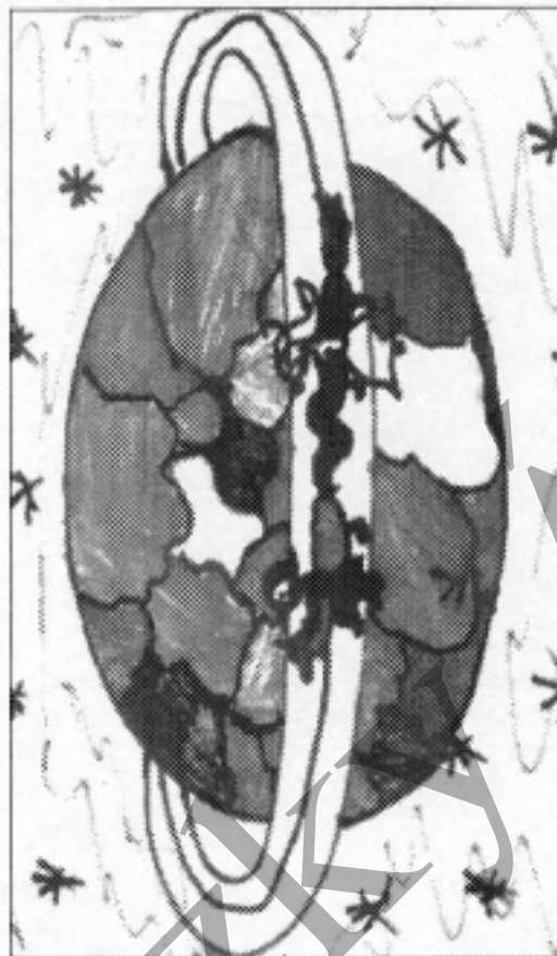
Muszorgszkij: Egy kiállítás képeiből Baba Yaga boszorkány Barta Erika rajza.