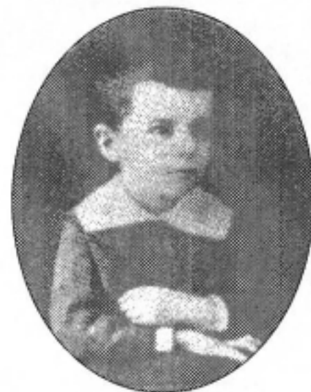
A GYERMEK BARTÓK

Március 25-én (éppen 5-ik születésnapján) kezdtük a tanulást, és április 23-án Bélanapkor egy kis négykezessel lepte meg az apját.”