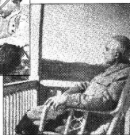
RIVERTONBAN 1941 NYARÁN