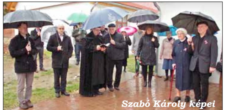
Szabó Károly képei

2023. március 14-én, kedden 17 órakor emlékeztünk meg a verőcei temető kertben az 1848-49-es forradalomról és szabadságharcról. Az Őszikék együttes tagjai versekkel és Kossuth-nótákkal elevenítették fel a forradalom emlékét, majd a Fejérdy Áron atya vezette közös imádság után falunk lakói nevében a képviselő-testület koszorút helyezett el a honvédsíron.